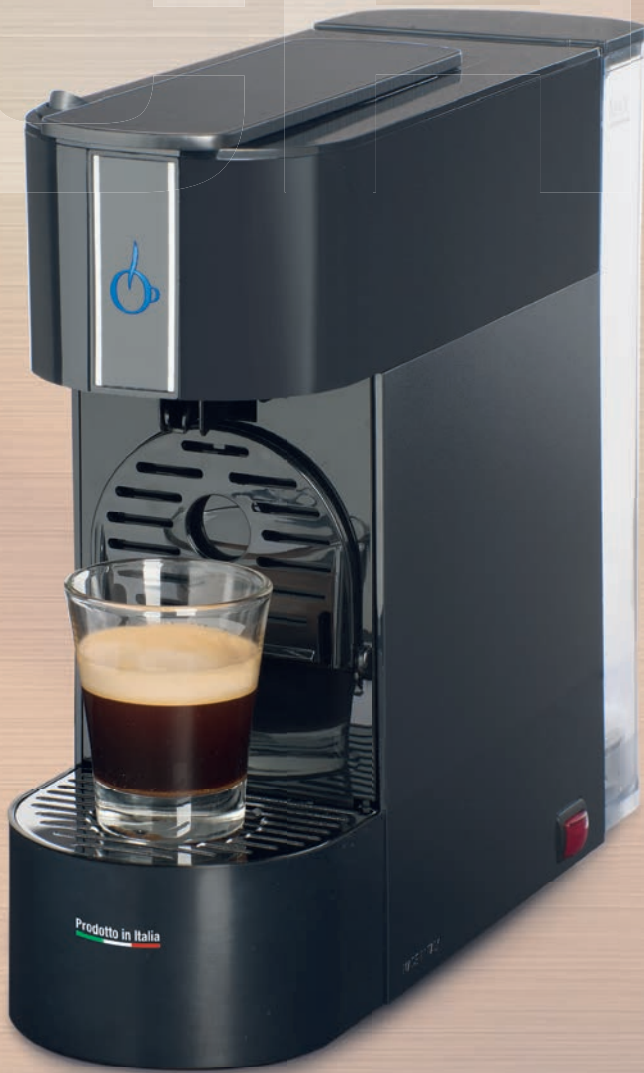
Modello manuale Manual model