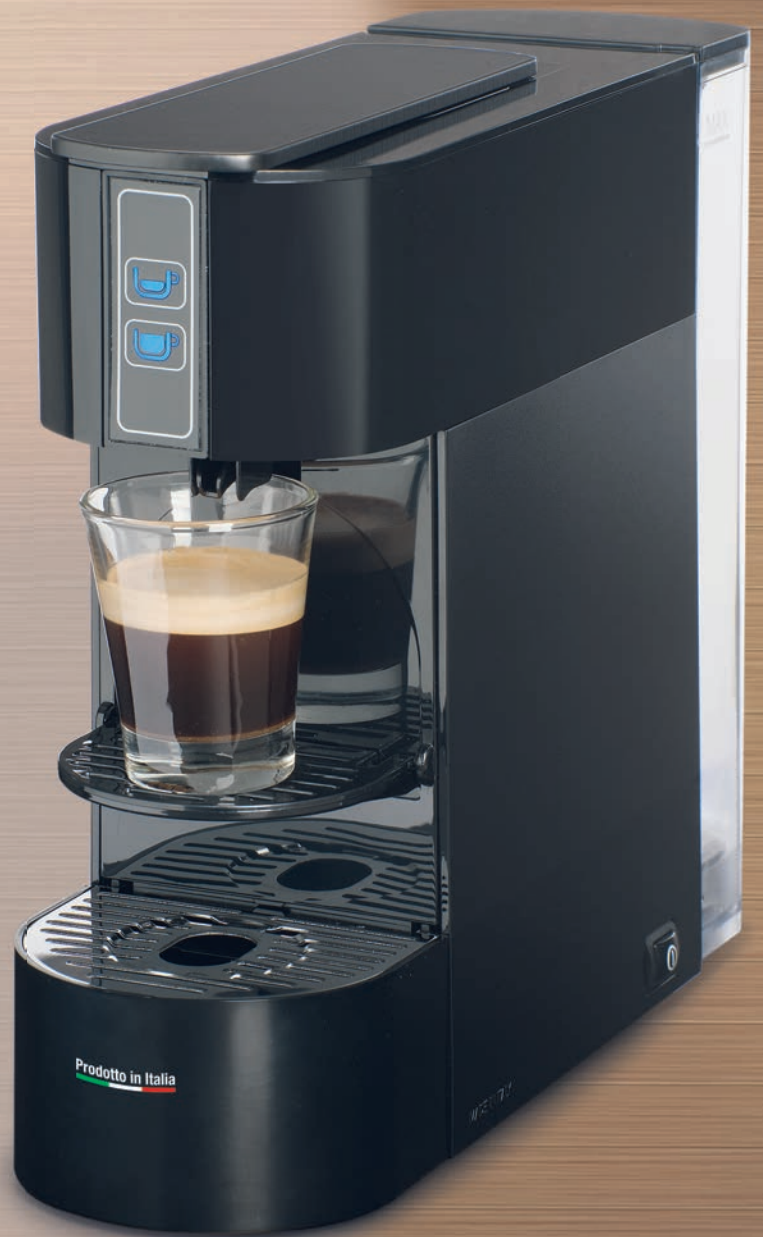
Modello elettronico Electronic model